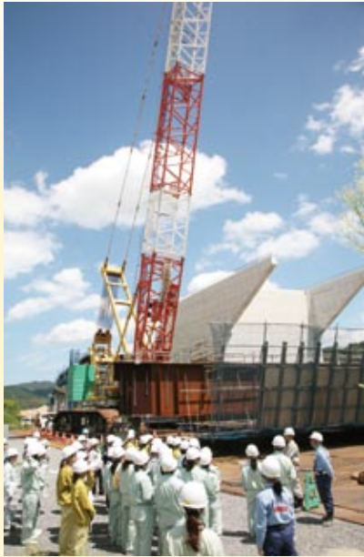
巨大クレーンを見上げる女性見学者の皆さん

を伝える、建設産業に對する理解を深めてもらうために企画されたもので、山口県内では初の試み。